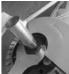
Рис.3 Замена дисков

Внимание! При установке дисков, на шпindel устанавливаются все промежуточные шайбы, обеспечивающие надёжную фиксацию дисков!