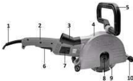
Рис. 2. Общий вид штробореза ШЭМ-150-4000