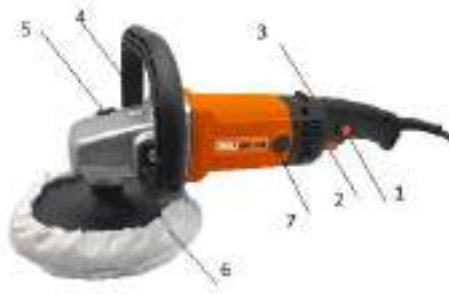
Рис. 1. Общий вид

4.3. Внешний вид машины представлен на рисунке 1.