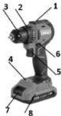
Рис. 1 Общий вид дрели

3.6. Внешний вид дрели показан на рисунке 1.