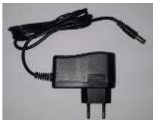
Рис. 2. Зарядное устройство

-извлечь штекер зарядного устройства из аккумулятора, вставить последний в дрель до щелчка фиксатора.