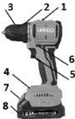
Рис. 1 Общий вид дрели

3.6. Внешний вид дрели показан на рисунке 1.