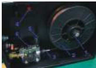
Рисунок 2. Механизм подачи проволоки.

Внимание! Чрезмерный прижим приводит к преждевременному износу прижимного ролика и самого механизма подачи!