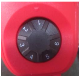
Рис.5 Регулятор оборотов

В зависимости от вида работы, типа насадки, обрабатываемого материала скорость инструмента требуется регулировать при помощи регулятора оборотов двигателя, см.рис.5