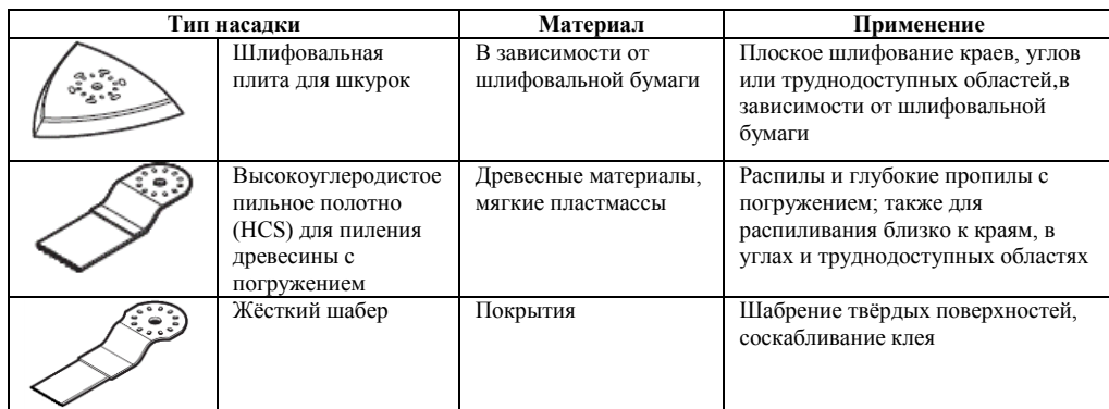
Тип и применяемость насадок таблица 3

4.2.3. Крепление насадок осуществляется посредством затяжки болта-9, см.рис.1