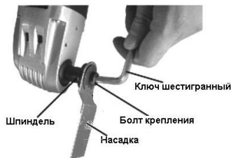
Рис.3 Крепление насадок