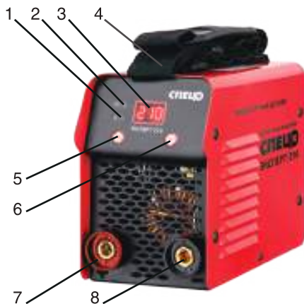
Рисунок 1. Общий вид.

На рис. 1. представлен общий вид инвертора.